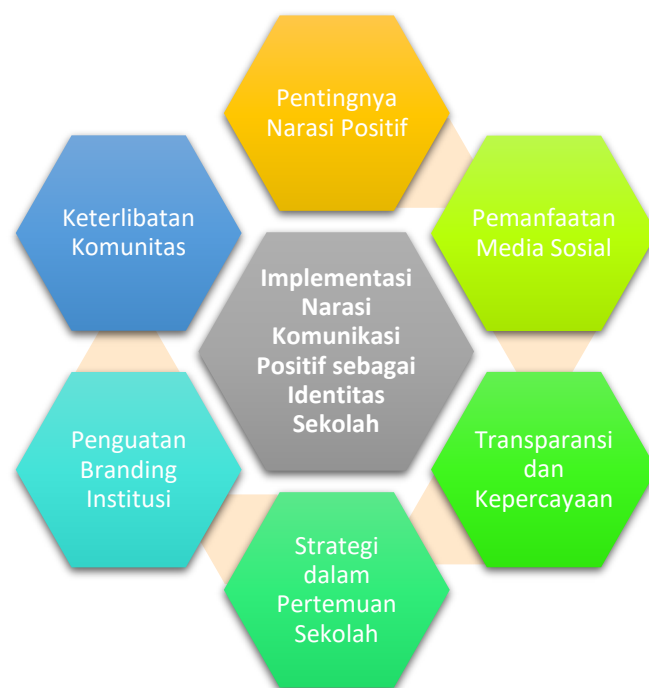
Gambar 1. Konsep Implementasi Narasi Komunikasi Positif sebagai Identitas Sekolah

Temuan ini mendukung teori komunikasi organisasi yang menekankan pentingnya narasi positif sebagai strategi branding. Menurut teori narasi dari Fisher cerita yang menarik dan otentik dapat membangun kepercayaan audiens. Implikasi dari temuan ini menunjukkan bahwa narasi positif dapat digunakan untuk menciptakan koneksi emosional yang lebih dalam antara sekolah dan komunitasnya, memperkuat kepercayaan, dan mendukung keberlanjutan program sekolah.