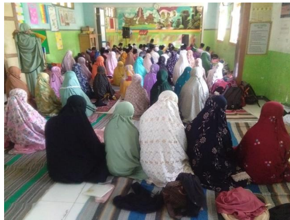
Gambar 4. Pelaksanaan Sholat Dzuhur Berjamaah di Mushollah SDN Cermee 1

Kebiasaan sholat dhuha di laksanakan setiap hari untuk kelas IV, V, dan VI saja, sholat dzuhur di ikuti oleh kelas IV, V, VI dilakukan setiap hari senin – kamis dengan guru menjadi imam dan siswa menjadi muadzin dan kebiasaan membaca sholawat badar sebelum masuk kelas, membaca doa sebelum pelajaran berlangsung, membaca surah-surah pendek sebelum KBM berlangsung, mengaji setiap hari jumaat (Al-Qur'an). Pada awalnya para siswa hanya sekedar mengikuti kebiasaan tersebut. Selain sholat dhuhur, siswa sudah terbiasa dengan melakukan sholat dhuha pada awal jam istirahat. Namun pada tahapan ini siswa sudah memiliki kesadaran dan akan melakukan sholat secara bersama walaupun tidak diperintah oleh guru.