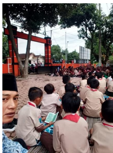
Gambar 6. Pembacaan Tahlil Dan Yasin Setiap Hari Jumaat Manis

Nilai kemasyarakatan terlihat ketika siswa saling bantu membantu, gotong rong, peduli kepada teman baik teman yang memiliki pembinaan khusus, serta pembacaan sholawat nariyah setiap hari jumaat dan sarwa akbar di sertai pembacaan tahlil dan surah yasin setiap hari jumaat manis untuk memberi sambungan doa kepada para pendahulu, serta wisata religi yang di laksanakan setiap setahun sekali untuk mengenang perjuangan para wali-wali Allah yang ada di jawa serta ngalap barokah.